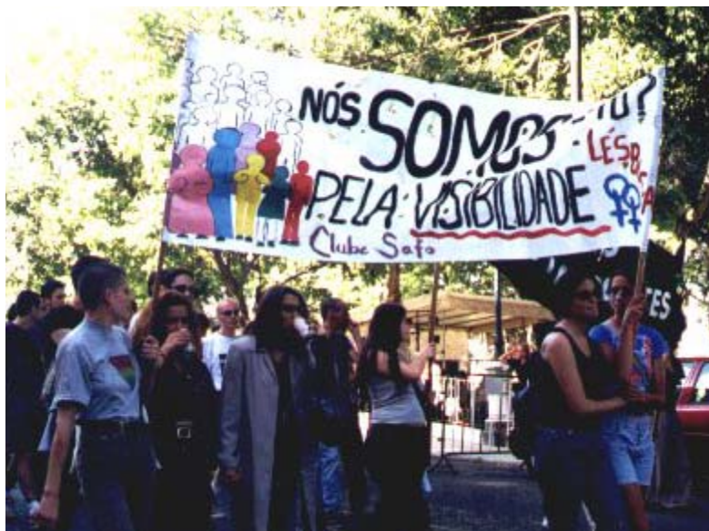
Figura 1 – Clube Safo na 1ª Marcha do Orgulho em 2000

A partir de 2000 a intervenção social e política do Clube Safo foi ganhando maior dimensão. Um dos aspectos mais relevantes desta nova fase é a participação na organização da 1ª Marcha do Orgulho em Portugal, realizada em Lisboa, dia 1 de Julho de 2000. As Marchas do Orgulho de Lisboa e do Porto são momentos marcantes da luta pelos direitos LGBT, e o Clube Safo esteve sempre presente na sua organização. A partir do momento que entrou em gestão administrativa, em 2008, por falta de candidatas aos órgãos sociais da associação, continua a participar como associação apoiante. De salientar que é a única actividade que mantém nesta fase de gestão administrativa.