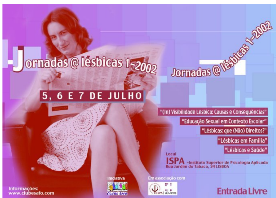
Figura 2 – Cartaz das Jornadas Lésbicas

As conclusões e foto reportagem estão disponíveis em http://www.clubesafo.com/galeria.htm na secção do ano 2002.