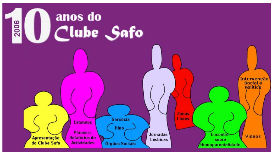
Figura 4 – Página inicial do CD comemorativa dos 10 anos

A 4 de Dezembro de 2006 é realizada a sessão comemorativa dos 10 anos do Clube Safo , no Fórum FNAC do Chiado, em Lisboa. É feito o lançamento de um CD comemorativo das actividades do Clube Safo.