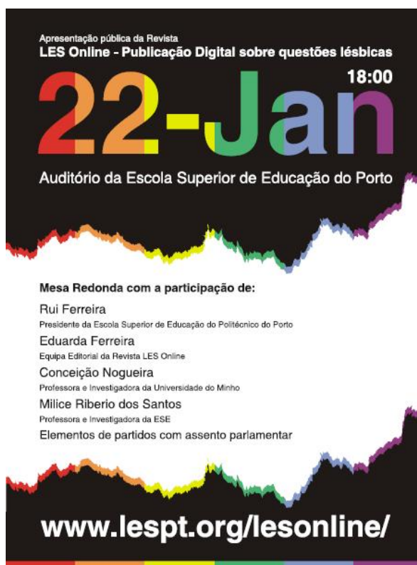
Figura 5 – Cartaz da sessão de apresentação pública da LES Online

As diferentes respostas das autoras e autores estão contidas nos artigos do Vol. 1, No 1 (2009) da LES Online, lançado em Dezembro de 2009 2 . No dia 22 de Janeiro de 2010 foi feita a apresentação pública da publicação na Escola Superior de Educação do Porto.